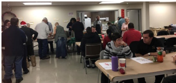
Noël à Mon Chez Nous