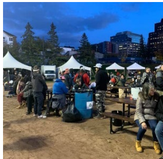
Nuit des sans-abri