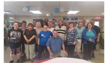
Traditionnelle fête de la St-Jean-Baptiste