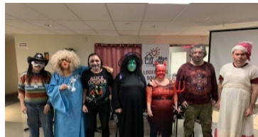
Fête de l'Halloween