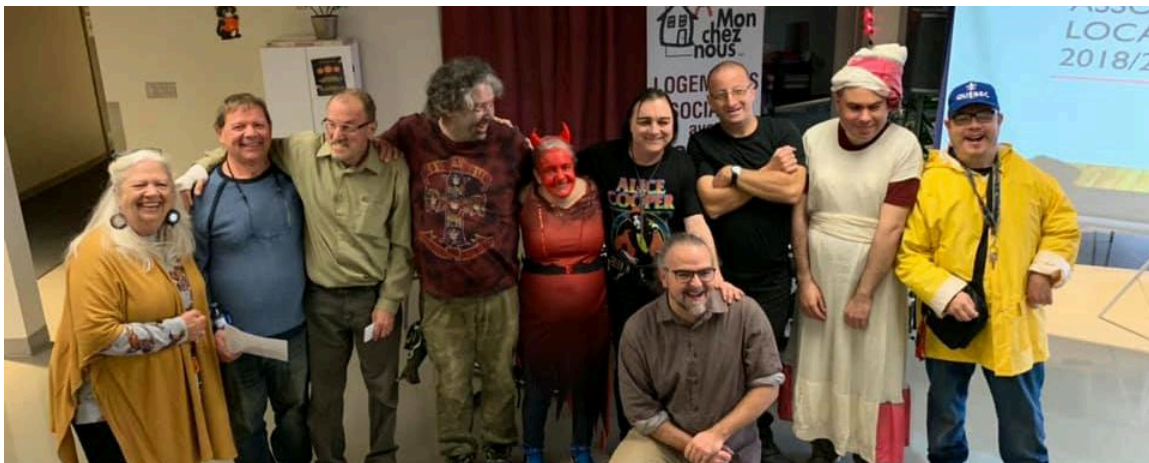
L'association des locataires, sans qui toutes ces activités ne pourraient avoir lieu.