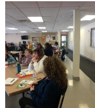
Formation offerte par le Centre de justice de proximité concernant l'importance d'avoir un testament