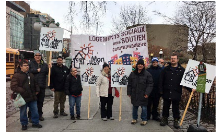
Manifestation pour faire valoir la nécessité de plus de logement sociaux