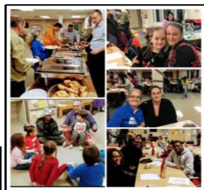
Party de Noël des familles 2018